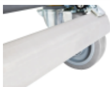
optie- isolatiecontainer- ergonomische- centrale-rem