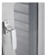
optie- isolatiecontainer- glazen-deur