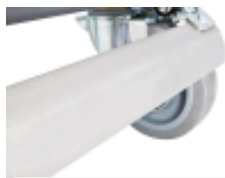
optie- isolatiecontainer- ergonomische- centrale-rem