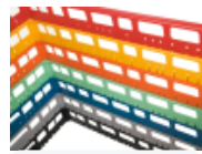
optie- bovenrand- clixrack-600