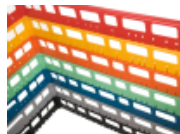
optie- bovenrand- clixrack-600