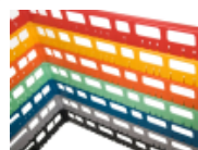
optie- bovenrand- clixrack-600